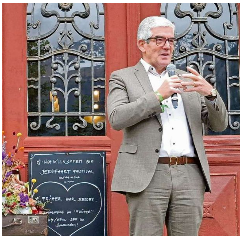
Grusswort vom abtretenden Regierungsrat Jon Domenic Parolini.