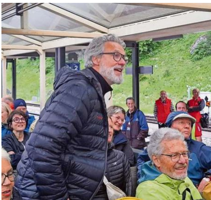
Grosse Begeisterung: Bahnfahrt mit Überraschungen.