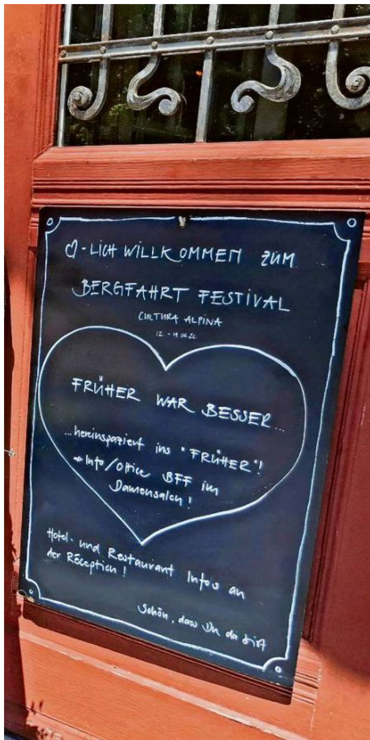
Eine herzliche Einladung ins Kurhaus.

unter anderem an der bescheideneren Holzstube ersichtlich ist. Falett erzählte auch von Offizieren in fremden Diensten und Zuckerbäckern, die in der Fremde zu Reichtum kamen und das Geld dann oft in Gebäude im heimatlichen Bergün investierten.